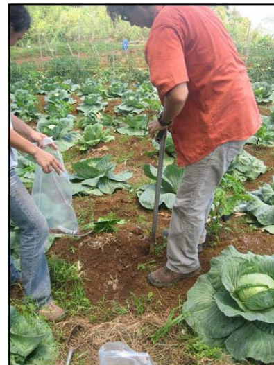
Prélèvement de sol en maraîchage (sol ferrallitique)